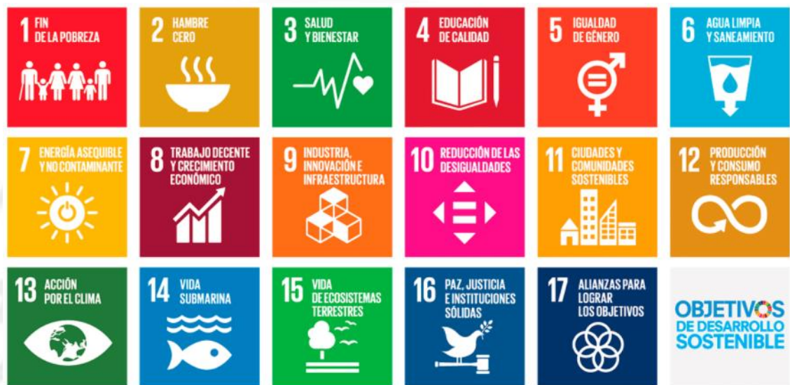
Imagen: Infografía de los 17 ODS

Los ODS conllevan un espíritu de colaboración y pragmatismo para elegir las mejores opciones con el fin de mejorar la vida, de manera sostenible, para las generaciones futuras. Proporcionan orientaciones y metas claras para su adopción por todos los países en conformidad con sus propias prioridades y los desafíos ambientales del mundo en general.